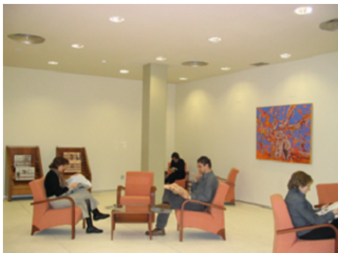
Sala de lectura de Prensa (Planta de acceso)

Esta sala tiene carácter polivalente, en ella se organizan exposiciones temporales de diversa índole.