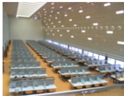
Sala general de consulta (primera planta)

El edificio ocupa una superficie de 10.266m 2 distribuidos en 3 plantas de acceso público y 1 planta de depósitos. Dispone de 843 puestos de lectura, todos ellos dotados de toma eléctrica para poder trabajar con ordenadores portátiles, y 89 puestos con ordenadores de uso público. Desde cualquier punto del edificio se tiene acceso a Internet, gracias a la tecnología Wi-Fi ( Wireless Fidelity )